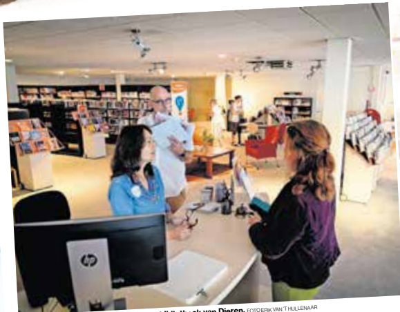
▲ Volop ruimte in de nieuwe, tijdelijke bibliotheek van Dieren.

De verbouwingsplannen voor De Bundel zijn nog niet klaar. Wel is duidelijk dat het gebouw niet groter wordt dan het nu is. De bibliotheek houdt de grootste ruimte, maar daarnaast moet naar verwachting een aantal kleinere ruimtes tot stand komen. Ook het Servicecentrum van de gemeente, het sociaal-gebiedsteam, de speeltoestel en de Rabobank blijven in De Bundel gehuisvest. Tijdens de verbouwing gaan de laatste twee ook naar het Scapinogebouw. Waar de eerste twee dan blijven, is nog niet zeker.