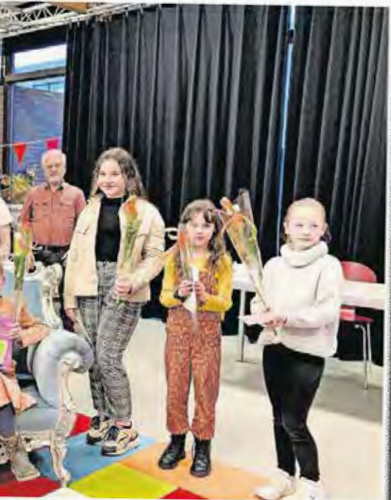
... uit Velp (midden) heeft de kwartfinale van de Nationale... plaats in de Bibliotheek Dieren. Op 5 maart zal zij... de nationale voorleeskampioen,