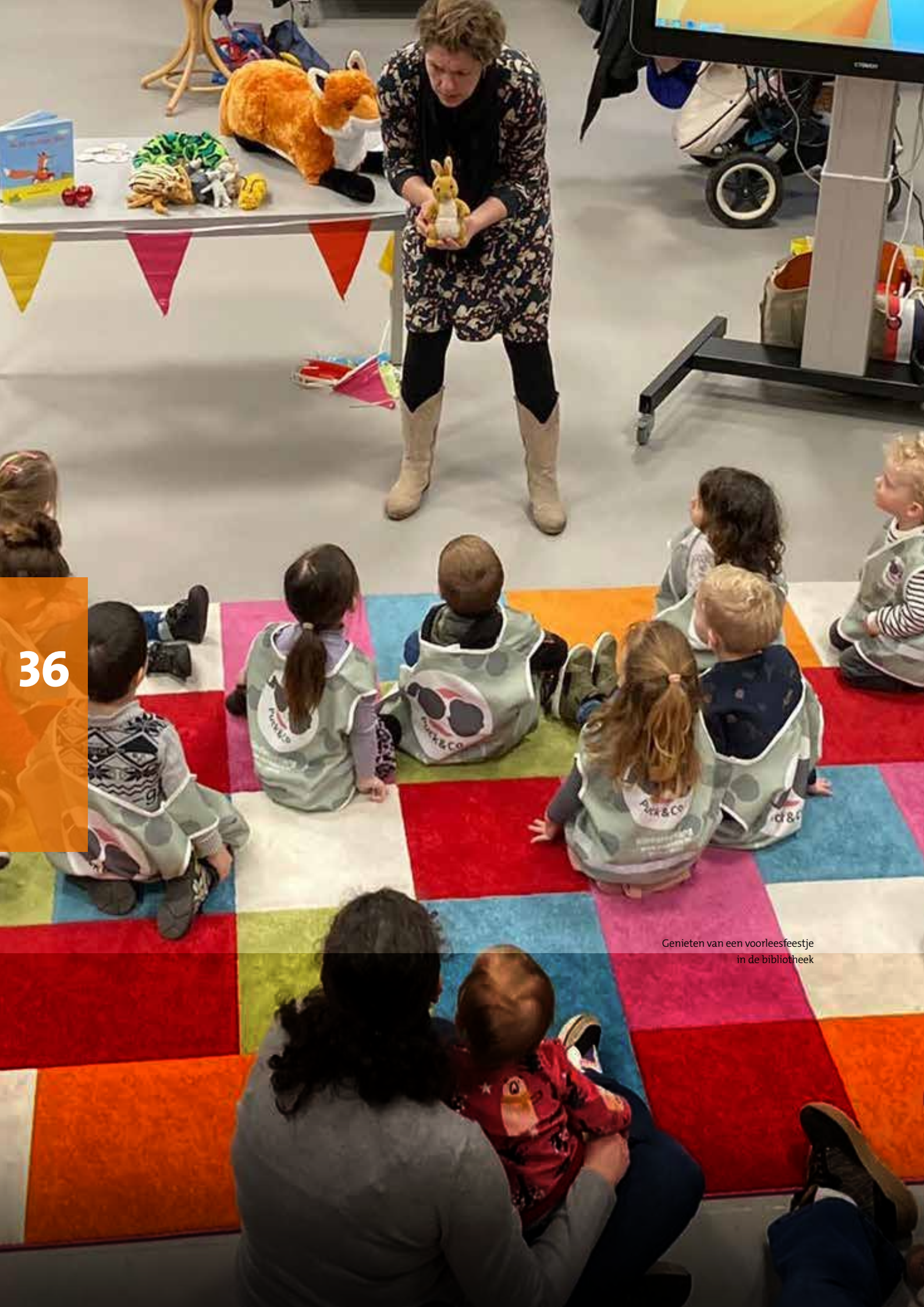
Genieten van een voorleesfeestje in de bibliotheek