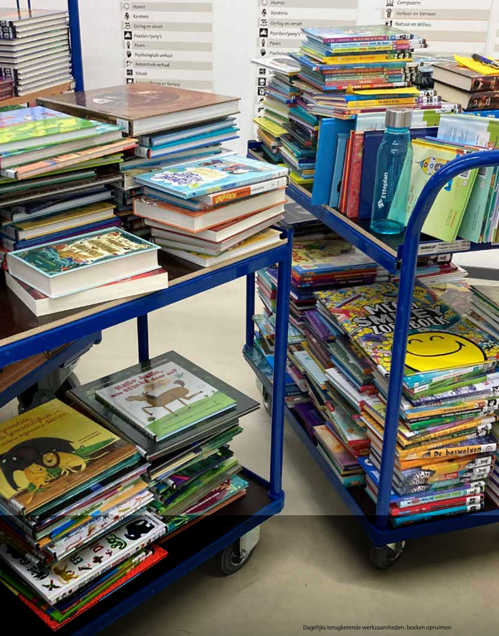
Dagelijks terugkerende werkzaamheden: boeken opruimen